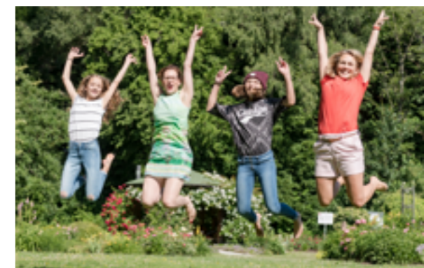
Von Jung bis Alt: Sie können dabei sein und mitgestalten!