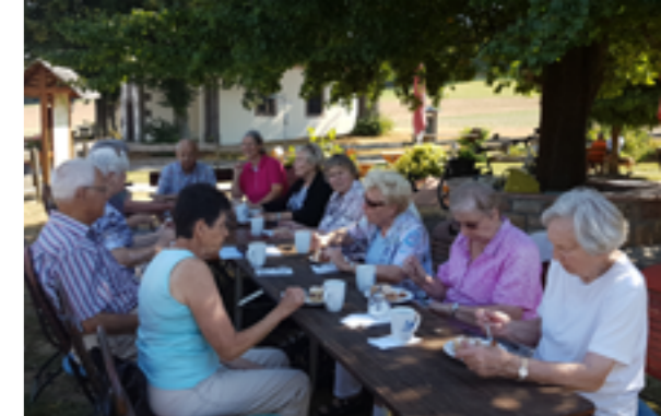
Selbstverständlich gehört auch die Geselligkeit während gemeinsamer Wanderungen und Ausflügen zur 5. Kneipp'schen Säule – der Lebensbalance.

Deshalb freuen wir uns über alle, die ihr Wissen in unseren Verein mit einbringen wollen. Wenn Sie Kurse oder Vorträge rund um unsere 5 Kneipp-Säulen anbieten können, nehmen wir Sie gerne in unser Programm mit auf – sprechen sie uns an. In Kooperation mit dem Umweltzentrum können wir auch Räumlichkeiten zur Verfügung stellen.